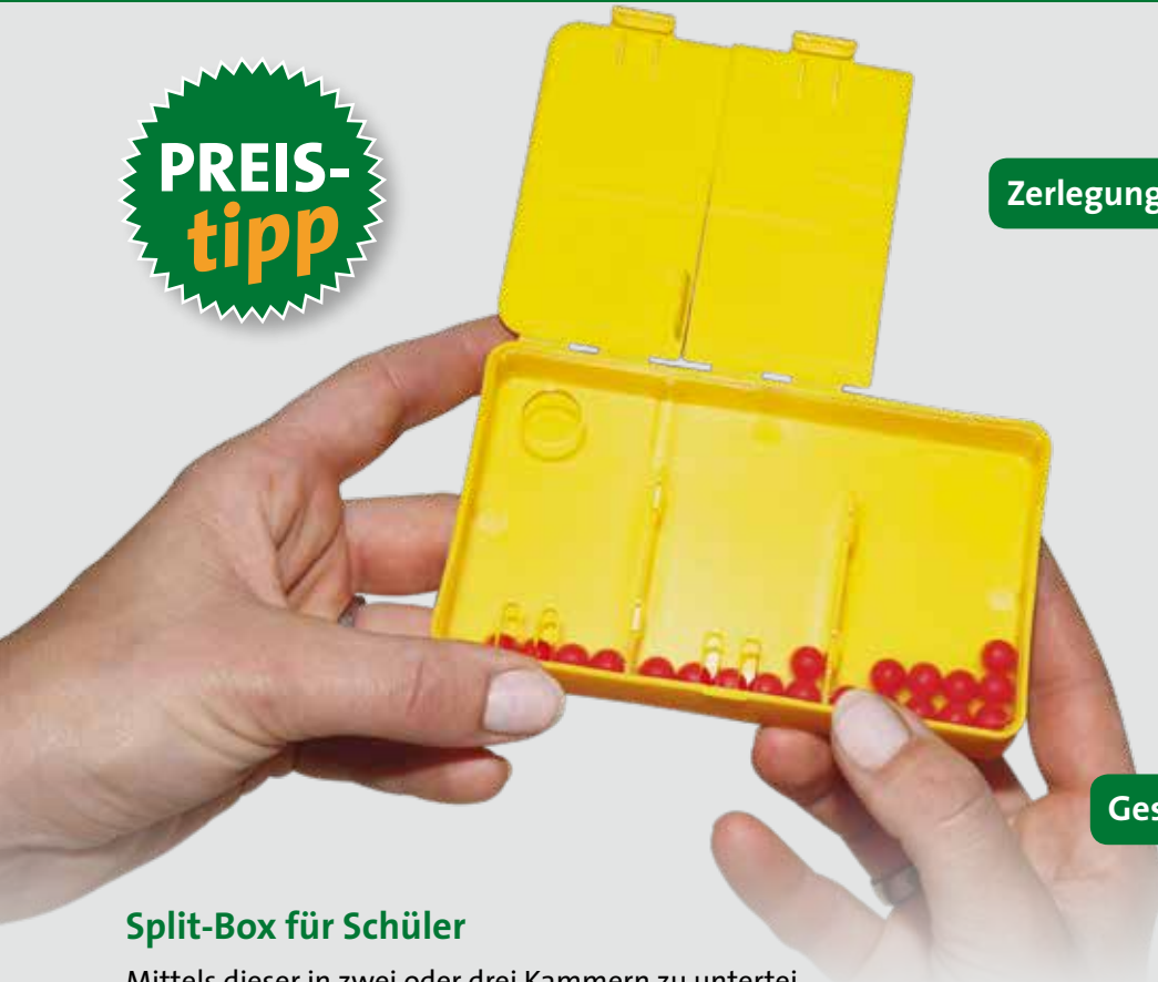
Zerlegung der Summanden